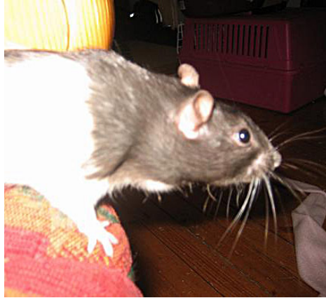
Hevelse på halsen